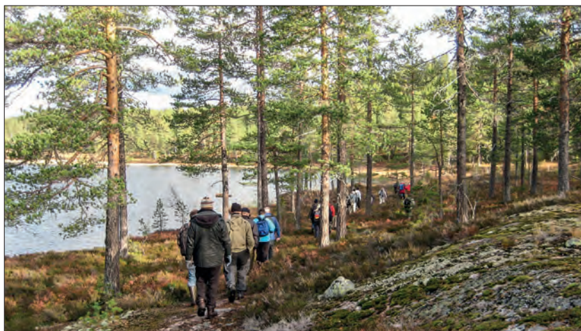
Figur 1: Tur på Flya ved Lauvliå i Sigdal i anledning av NaKuHel-konferansen «How to cope in a changing world? – Environment, Culture and Health in transition».