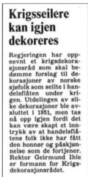
Figur 47 Aftenposten 1986-10-27.

Eitinger-utvalget foreslo at en forenklet saksbehandling av årsakskravet skulle ivaretas ved en vurdering av graden av påkjenninger.