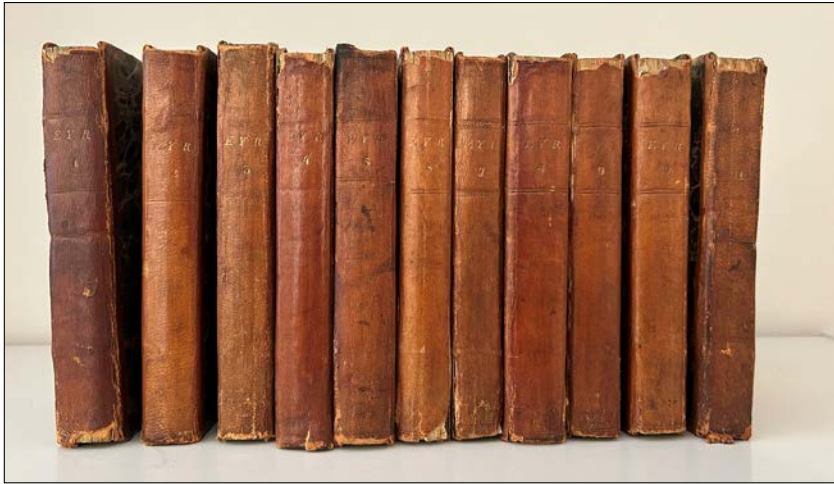
Figur 2. I alt 43 hefter av Eyr er samlet i 11 årgangsbind fra 1826 til 1836/1837.