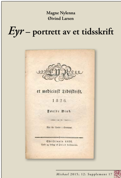
Figur 1. Eyr, det første, norske medisinske tidsskriftet var viktig i utviklingen av en nasjonal, norsk medisin og i utformingen av en norsk legerolle.

Det er uvisst hvor mange enkeltutgaver av Eyr som finnes i dag, men det er neppe mange. Ettersom vi må anta at det bare var et lite antall som ble bundet inn, og især som komplette samlinger, er gaven fra Cappelen Damm meget sjelden.