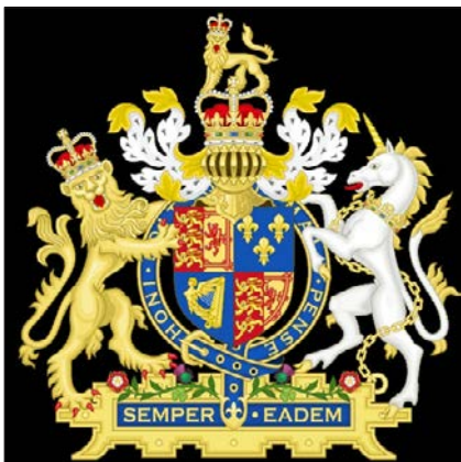
Figur 1. Enhjørningen er brukt i mange våpenskjold, blant annet i Storbritannias riksvåpen, som vi ser her. Til enhjørningens horn knytter det seg overtroiske forestillinger, særlig om dets legende kraft (Illustrasjon fra Wikimedia Commons).